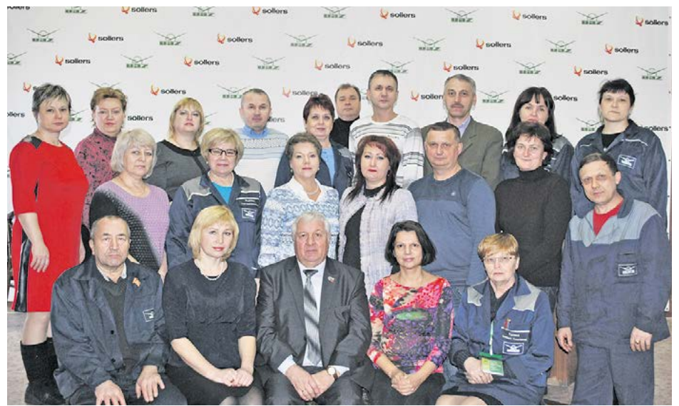
■ Профсоюзный актив. 2017 год

В 2000 г. профком разработал пять целевых программ по охране труда, рационализации рабочего места, вентиляции, экологии и снижению шума и вибрации. С участи-