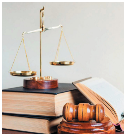
ГРАФИК ВЫЕЗДНЫХ КОНСУЛЬТАЦИЙ НА ФЕВРАЛЬ 2024 ГОДА

Члены Профсоюза АСМ РФ вправе обращаться за юридической помощью в любой пункт выездных консультаций, независимо от структурного подразделения Первичной профсоюзной организации АО «АВТОВАЗ» АСМ РФ, в котором они состоят на учёте.