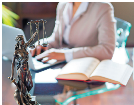
ГРАФИК ВЫЕЗДНЫХ КОНСУЛЬТАЦИЙ НА ОКТЯБРЬ 2023 ГОДА

Члены Профсоюза АСМ РФ вправе обращаться за юридической помощью в любой пункт выездных консультаций, независимо от структурного подразделения Первичной профсоюзной организации АО «АВТОВАЗ» АСМ РФ, в котором они состоят на учёте.