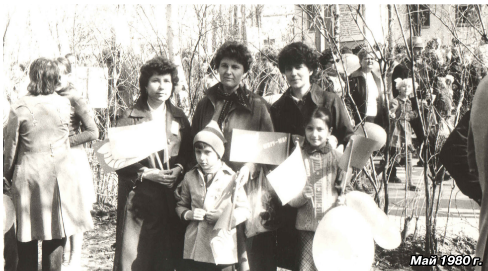
Май 1980 г.