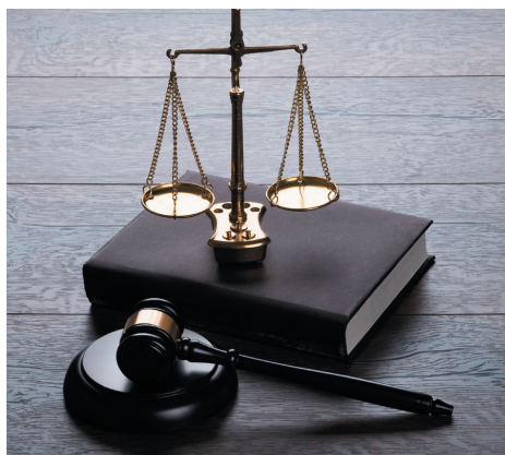
График выездных консультаций юридического отдела ППО АО «АВТОВАЗ» АСМ РФ на октябрь 2022 года