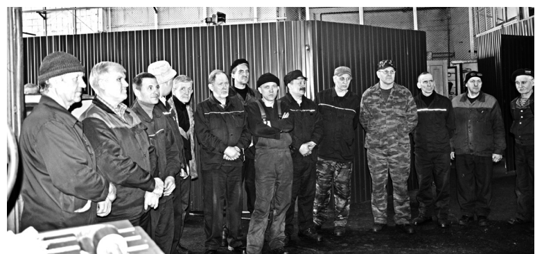
Участники в цехе перед конкурсом