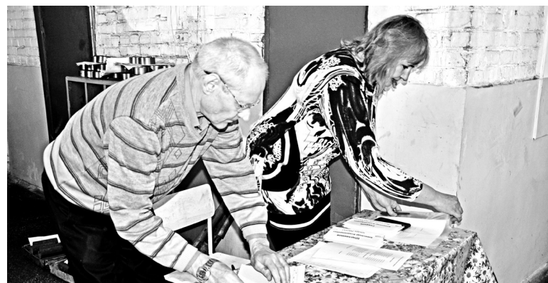
Процесс подготовки к конкурсу