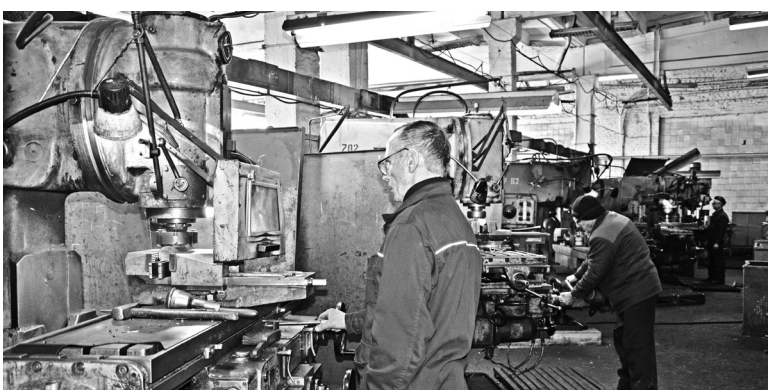
Фрезеровщики за работой

15 марта 2018 года на АО «Алтайский завод агрегатов» прошел конкурс профессионального мастерства в номинациях «Лучший токарь» и «Лучший фрезеровщик».