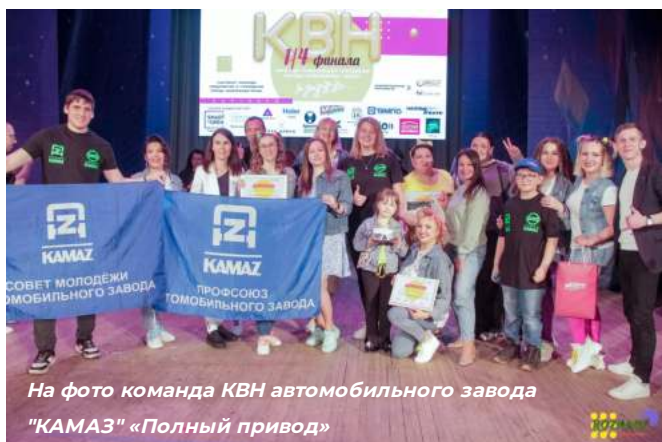
На фото команда КВН автомобильного завода "КАМАЗ" «Полный привод»

5 сентября в Уфе состоится Всероссийский профсоюзный фестиваль КВН среди трудящейся молодежи: «За социальное партнёрство!» Организаторы фестиваля - Федерация профсоюзов Республики Башкортостан, Молодежный совет ФНПР, государственный комитет РБ по молодежной политике и МОО "Клуб веселых и находчивых в г. Уфы" РБ.