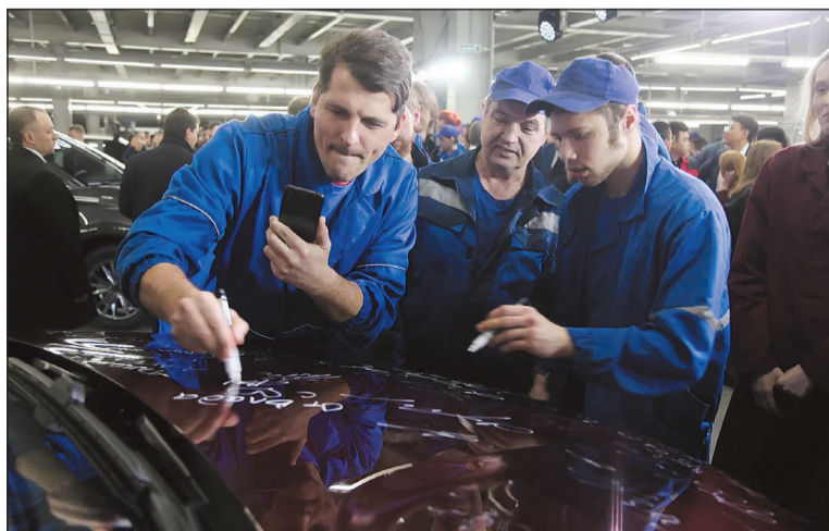
Участники группы запуска SWM оставили свои пожелания новому проекту.

«АВТОТОР и Shineray встают на путь долгосрочного взаимовыгодного сотрудничества. Серьезность планов на-