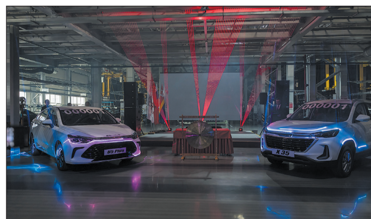
Лазерное шоу на церемонии старта производства ВАIC.

«У АВТОТОР есть планы по дальнейшему наращиванию