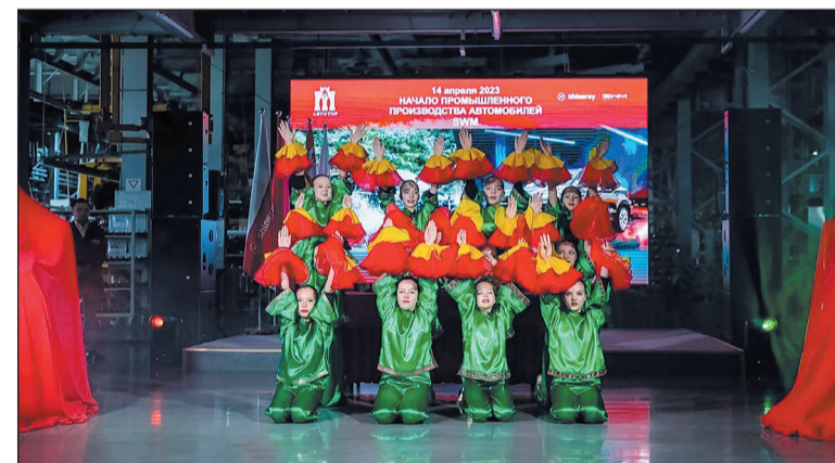
Выступление юных талантов с китайским танцем на церемонии начала производства автомобилей SWM.

«Сегодня очень важный день для всех. Сегодня день официального старта производства нашей продукции на территории России. Наша компания считает российский рынок одним из самых перспективных для развития. Мы готовы предложить российским потребителям современные высококачественные автомобили в наиболее востребованных сегментах рынка. Мы намерены вслед за промышленной сборкой автомобилей освоить и производство по полному технологическому циклу, включая сварку и окраску кузовов, сборку двигателей, редукторов, коробок передач. Подобный опыт у нашей компании уже есть, в