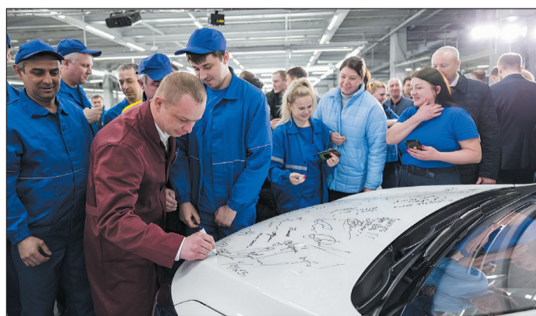
По традиции участники церемонии оставили свои автографы на капотах новых автомобилей.

«Это качество, которое обеспечивает АВТОТОР, это опыт компании, это подготовленность производственных мощностей, и вообще отношение к рынку и потребителям. Мы выбрали компанию АВТОТОР потому, что это, на наш взгляд, одна из лучших автомобильных компаний в России. Мы знаем, что она надежна и с ней можно развиваться дальше».