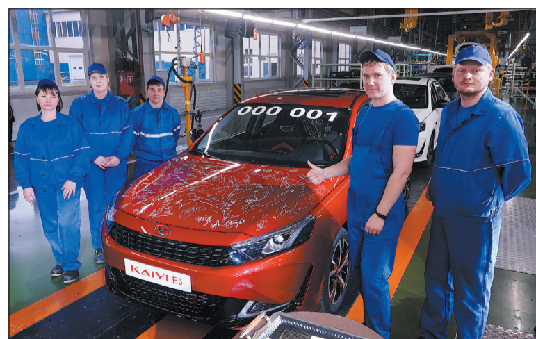
По устоявшейся традиции гости церемонии и работники АВТОТОР оставили свои автографы на капоте первого автомобиля нового бренда.